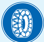
「チェーン規制」の区間であることを表す標識

A 「大雪特別警報」や「大雪に対する緊急発表」がおこなわれるような異例の大雪があるときにおこないます。 ※2022年度においては「大雪に対する緊急発表」が全国で6回発表されました。